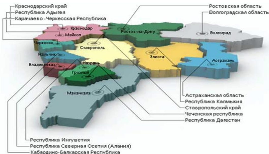
Рис. 1. Северо-Кавказский федеральный округ и субъекты РФ, граничащие с ним

Инвестирование является одним из важнейших источников экономического роста Северо-Кавказского федерального округа (СКФО) и основой научно-технического прогресса. В состав Северо-Кавказского федерального округа входят 7 субъектов (регионов) Российской Федерации: Республика Дагестан, Республика Ингушетия, Кабардино-Балкарская Республика, Карачаево-Черкесская Республика, Республика Северная Осетия-Алания, Ставропольский край, Чеченская Республика. (рис.1) Успешное решение задач обеспечения устойчивого и сбалансированного экономического роста СКФО на основе диверсификации экономики и повышения ее конкурентоспособности в значительной степени зависит от формирования и реализации стимулирующей политики привлечения инвестиций, которые оказывают существенное влияние на уровень социально-экономического развития региона [1]. За прошедший год в сфере инвестиционной привлекательности Северного Кавказа произошли знаковые изменения. Несмотря на то, что уровень инвестиционной привлекательности регионов СКФО остаётся ниже среднего по России, уже видна положительная динамика в оценках инвестиционной привлекательности территорий округа, усилилось и внимание к проблемам СКФО со стороны федерального центра.