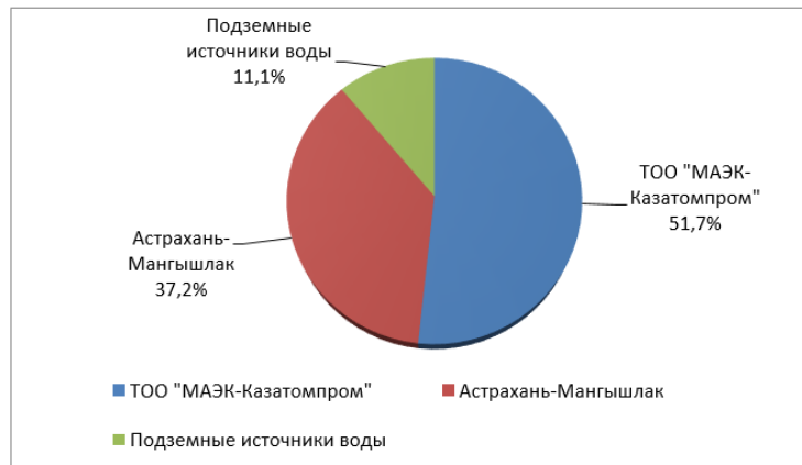
Рисунок 1. Существующие источники воды по Мангистауской области

Сегодня в основном потребность области в пресной воде обеспечивается опреснительными установками ТОО «МАЭК-Казатомпром», а также транспортируемой по водоводу «Астрахань-Мангышлак» волжской водой [4].